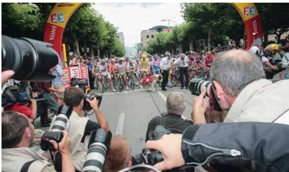
Le Tour de France à Martigny, en juillet 2009.