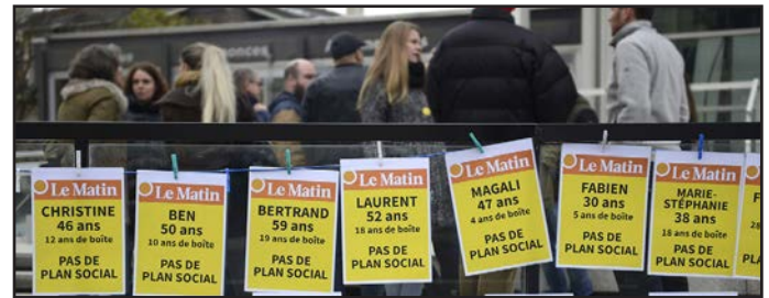
2018: grève de l'ATS et des rédactions romandes de Tamedia. Streik der Westschweizer Redaktionen von Tamedia und SDA.