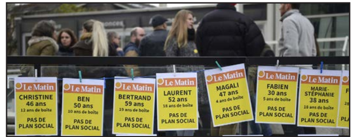
2018: grève de l'ATS et des rédactions romandes de Tamedia. Streik der Westschweizer Redaktionen von Tamedia und SDA.