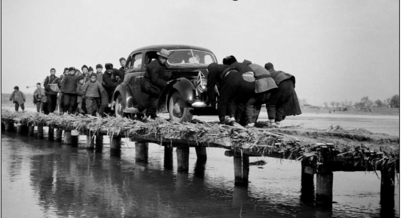
Walter Bosshard: Auf dem Weg zum Konfuziustempel in Qufu, China, um 1938

Walter Bosshard (1892–1975) ist der erste Schweizer Fotojournalist, der mit seinen Reportagen international berühmt wurde. Schon um 1930 erreichten seine Bildberichte ein Millionenpublikum. Ab 1931 konzentrierte sich Bosshard auf China: Fotografierend und schreibend verfolgte er den verheerenden Krieg mit Japan und den Machtkampf zwischen Nationalisten und Kommunisten, er widmete sich aber auch dem Alltag und dem Leben auf der Strasse. Die Ausstellung der Fotostiftung Schweiz präsentiert neben Klassikern auch viele unbekannte Fotografien, die erst in jüngster Zeit zum Vorschein gekommen sind. Diese werden den China-Bildern des Starreporters Robert Capa gegen- übergestellt – Capa arbeitete an denselben Orten wie sein Freund Walter Bosshard und wetteiferte mit ihm um Auftritte in der Zeitschrift Life. https://www.fotostiftung.ch