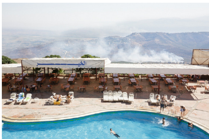
Marmarita, Reef Homs, 11 septembre 2013

Walter Bosshard (1892–1975) ist der erste Schweizer Fotojournalist, der mit seinen Reportagen international berühmt wurde. Schon um 1930 erreichten seine Bildberichte ein Millionenpublikum. Ab 1931 konzentrierte sich Bosshard auf China: Fotografierend und schreibend verfolgte er den verheerenden Krieg mit Japan und den Machtkampf zwischen Nationalisten und Kommunisten, er widmete sich aber auch dem Alltag und dem Leben auf der Strasse. Die Ausstellung der Fotostiftung Schweiz präsentiert neben Klassikern auch viele unbekannte Fotografien, die erst in jüngster Zeit zum Vorschein gekommen sind. Diese werden den China-Bildern des Starreporters Robert Capa gegen- übergestellt – Capa arbeitete an denselben Orten wie sein Freund Walter Bosshard und wetteiferte mit ihm um Auftritte in der Zeitschrift Life. https://www.fotostiftung.ch