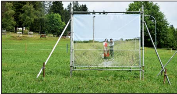
La Vue-des-Alpes NE